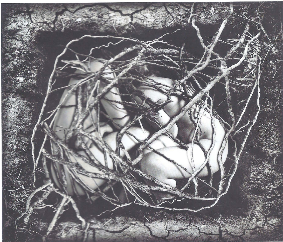
Louwe Delfieu Page de gauche : Françoise Peslherbe

Une photographie non consumériste, non stéréotypée, non documentaire, non évidente. Hors des conventions photographiques. (extrait du manifeste de Transfiguring)